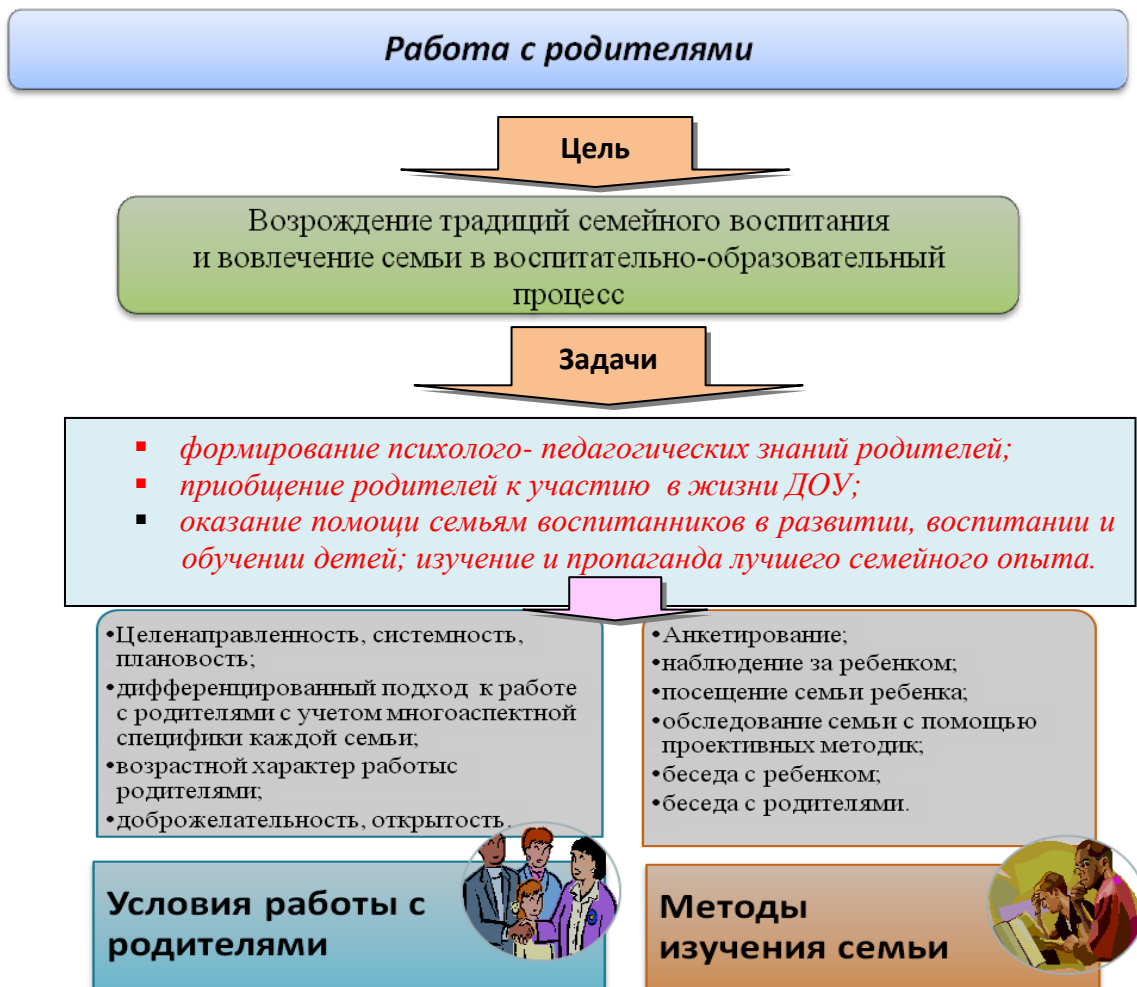
Рис. Модель работы с родителями