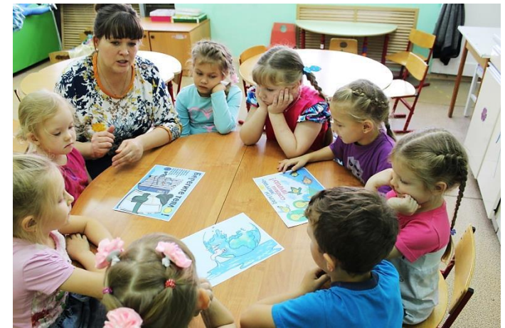
Познавательное занятие «Простые истины для бережливых»