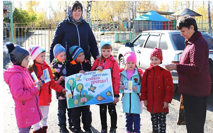
Акция « Береги электроэнергию»