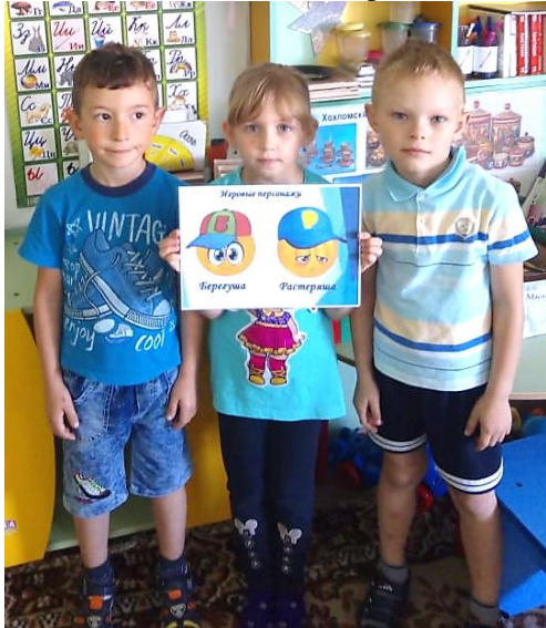
Знакомство с «Берегушей» и «Растеряшей»