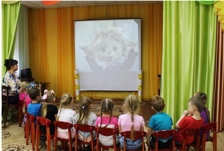
Просмотр отрывка из мультфильма «Сказка о потерянном времени»